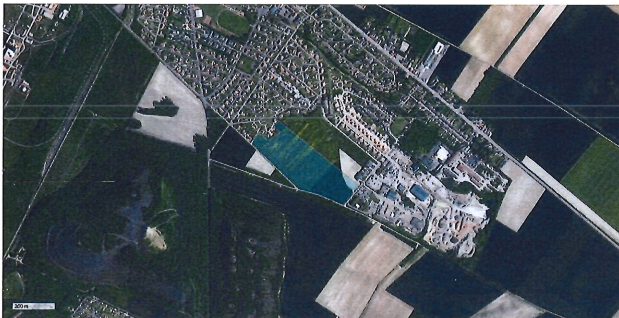
Vue aérienne du site d'implantation du projet dans son environnement (DREAL Hauts-de-France)