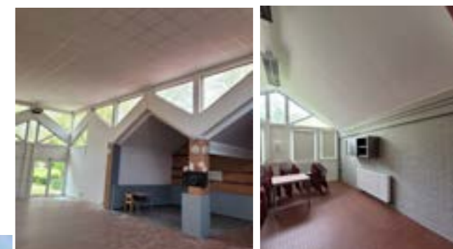
Foyer Gonthier : peinture dans les salles et réfection du plafond de la pièce principale, suite à la rénovation de la charpente.