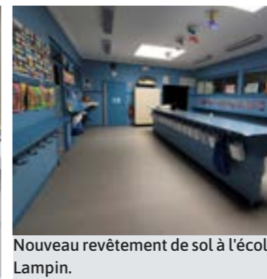
Nouveau revêtement de sol à l'école Lampin.