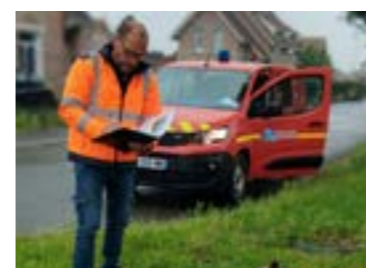
Contrôle périodique "Défense extérieure contre l'incendie" par un pompier professionnel et l'assistant de prévention de la commune.