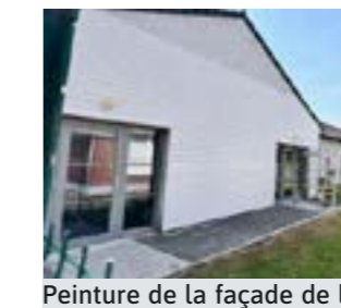
Peinture de la façade de la Maison France Services.