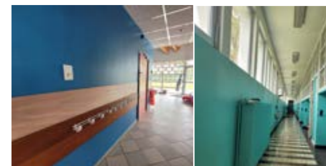
Peintures des couloirs à l'école Kergomard et à l'école Jaurès.