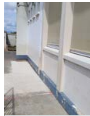
Pente pour personnes à mobilité réduite à l'école Kergomard.

Rénovation, peintures, changement de menuiseries... la Ville de Mazingarbe entretient toute l'année ses bâtiments, sans oublier les espaces verts.