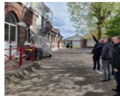
Façade de l'école Pasteur : cache-moineaux, appuis de fenêtres, peinture de la façade, bas de murs.