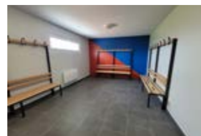
Création de deux vestiaires au stade Baillieux. Les joueurs de l'Etoile club bénéficient ainsi de locaux neufs.