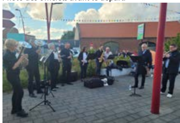
L'harmonie municipale a interprété des morceaux festifs avant le départ de la Gentlemen, le 16 mai.