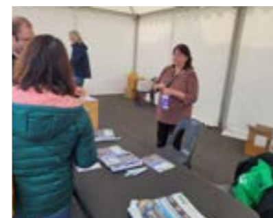
La Municipalité avait mis en jeu 8 maillots officiels pour les offrir par tirage au sort sur le stand officiel et via l'application mobile MazAppli.