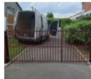
Installation d'un portail à l'école Lampin. et au 44 rue Lefebvre.