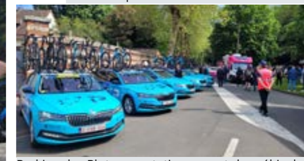
Parking des Platanes : stationnement des véhicules d'assistance présents sur la course.