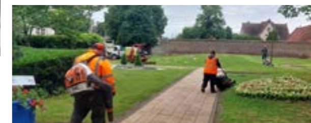
Embellissement des parcs et de la ville.