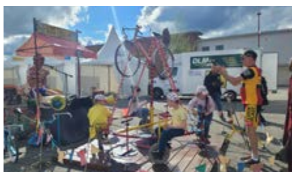
Le Tour à Biclou était proposé lors des 2 courses.